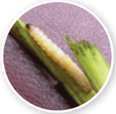
HAMA PENGGEREK BATANG

Penggerek Batang Padi pada stadia reproduktif merusak tanaman padi dengan merusak pembentukan malai.